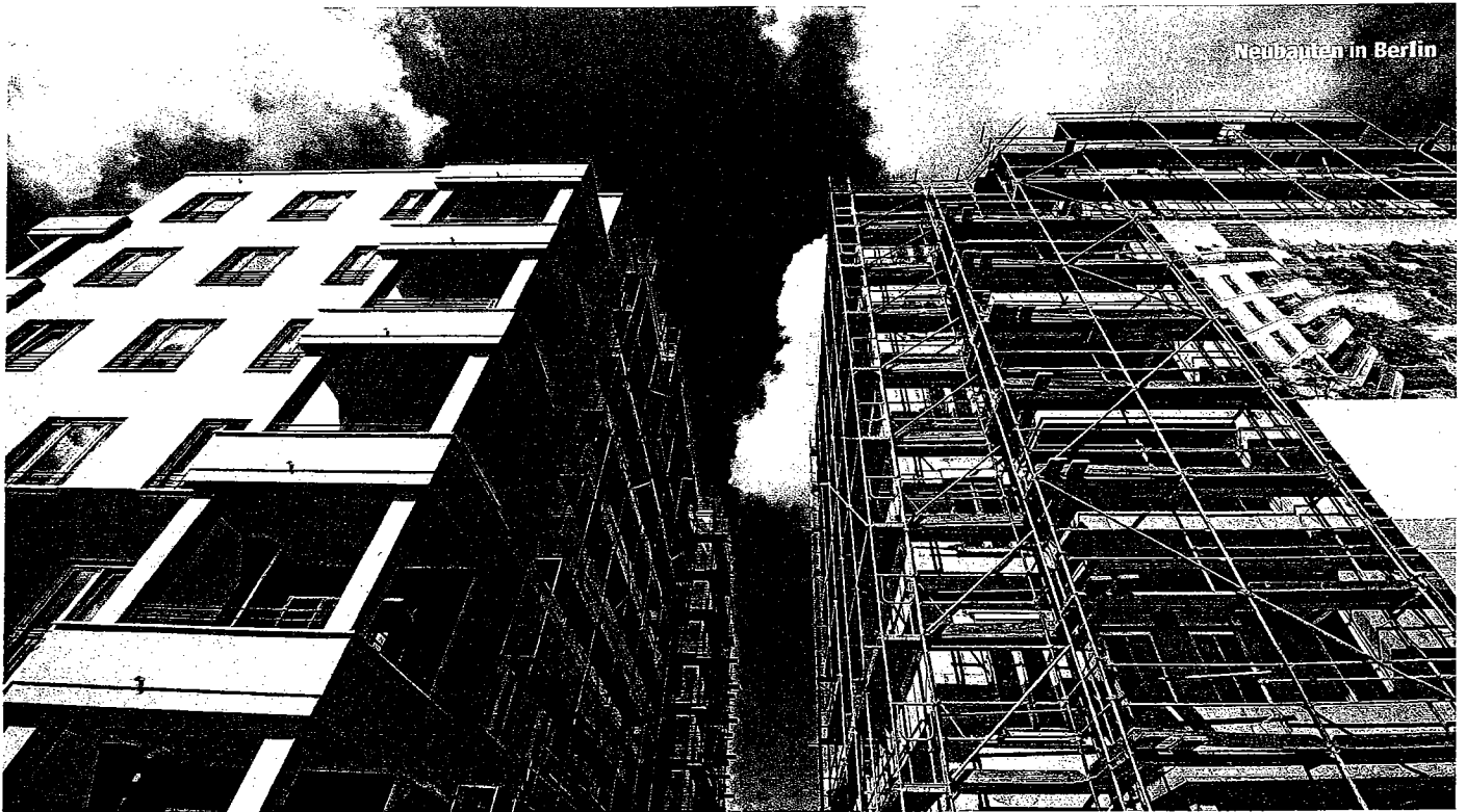
Neubauten in Berlin